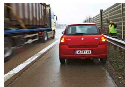
Auf dem Seitenstreifen halten ist okay, wenn zum Beispiel Fahrer oder Insassen schlecht wird

Einer der schlimmsten Verstöße im Straßenverkehr ist das Überfahren einer roten Ampel. In welchen Situationen dürfen Autofahrer trotzdem das Rotlicht missachten und in die Kreuzung einfahren?