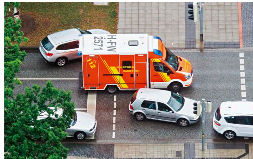
Rettungswagen: In diesem Fall darf man trotz roter Ampel vorsichtig in die Kreuzung einfahren

Nein. Schienenfahrzeuge, z. B. Straßenbahnen, dürfen rechts überholt werden, wenn die Fahrbahn rechts der Schienen verläuft. Steht ein Auto auf der Linksabbiegespur, darf man ebenfalls rechts vorbeifahren. Auch bei Stau ist Rechtsüberholen erlaubt: Bei mehrspurigen Straßen darf man rechts an