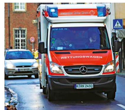
Gattin mit Wehen: Der werdende Vater darf dem Rettungswagen auch mit hohem Tempo folgen

Nein. Schienenfahrzeuge, z. B. Straßenbahnen, dürfen rechts überholt werden, wenn die Fahrbahn rechts der Schienen verläuft. Steht ein Auto auf der Linksabbiegespur, darf man ebenfalls rechts vorbeifahren. Auch bei Stau ist Rechtsüberholen erlaubt: Bei mehrspurigen Straßen darf man rechts an